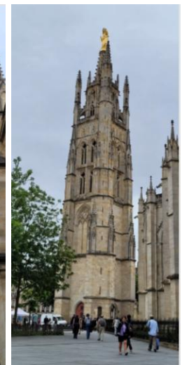
Au détour de nos déambulations dans les rues de Bordeaux