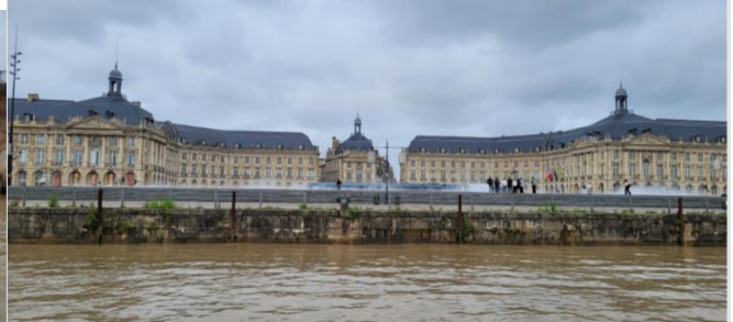
Oui c'est bien la Garonne....mais pas le pont Neuf !!!