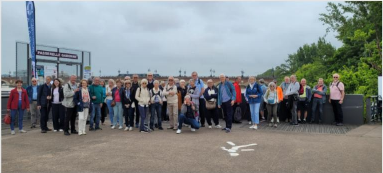
Prêts pour l'embarquement et la navigation sur la Garonne

séjour a commencé : à pied, en tram, en bus à impériale, en bateau pour découvrir en deux jours la ville de Bordeaux.