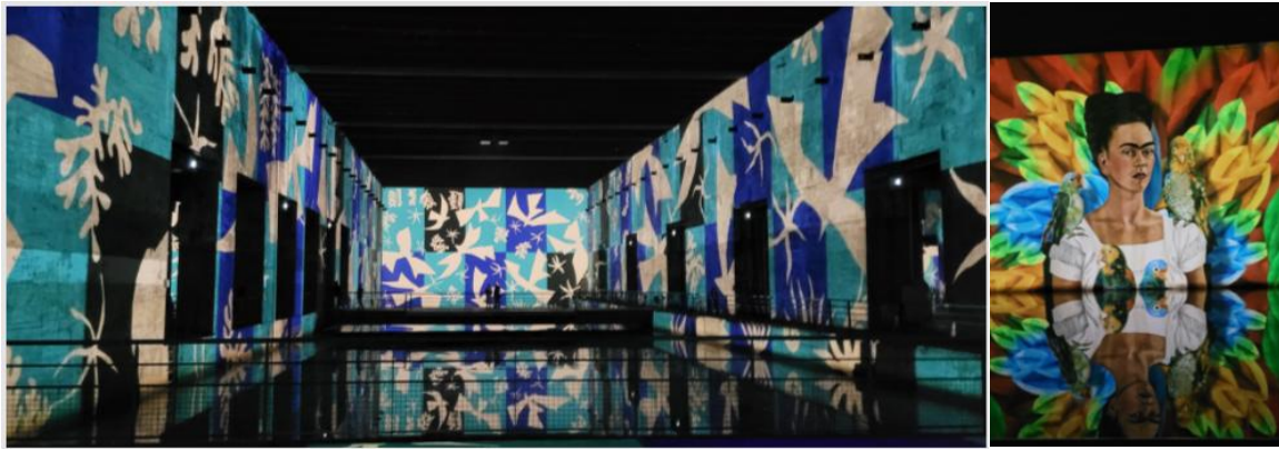
Matisse et Frida Kahlo au bassins des lumières

C'est ensuite en 1/2 groupe que les visites nous ont entraînés à la chapelle de Condat