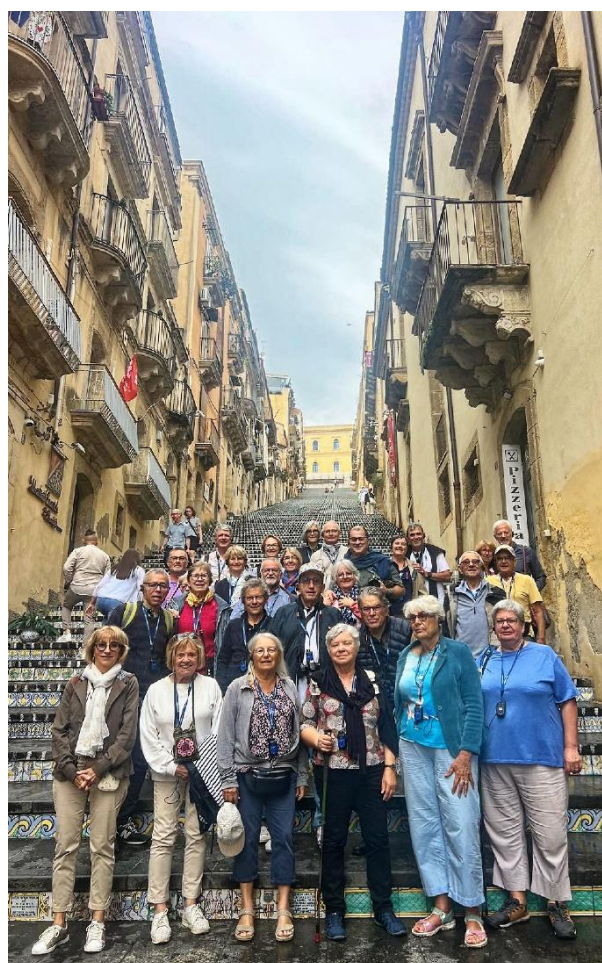
Les deux groupes dans un même décor !